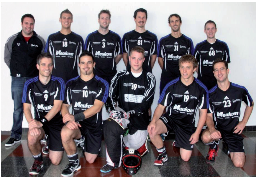
Das Herren 1 des UHC Phantoms Rafzerfeld

Die Heimrunden unserer Damenmannschaft und unseres Fanionteams weisen eine Gemeinsamkeit auf: Sie waren beide leider nicht sehr erfolgreich. Währenddem sich unsere Damen Ende September immerhin noch einen Punkt gut schreiben