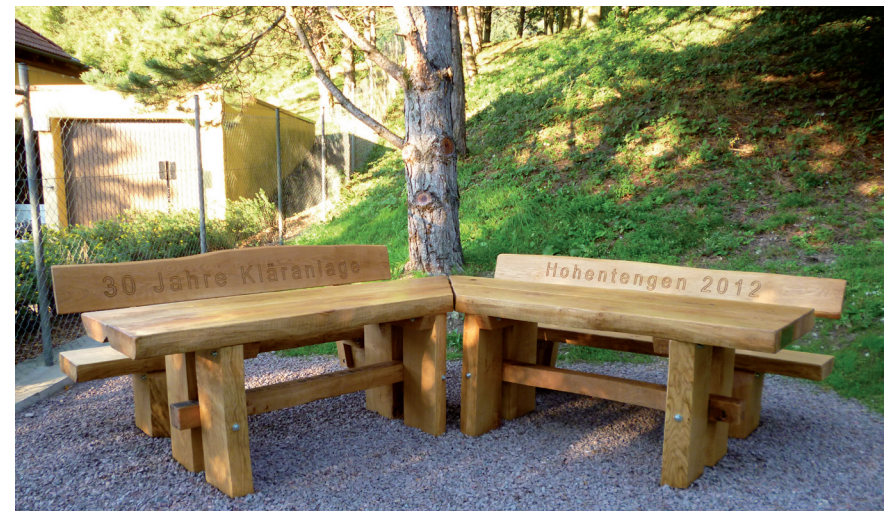
Eichenholzsitzbankgruppe: hergestellt durch den Forstdienst Rafz