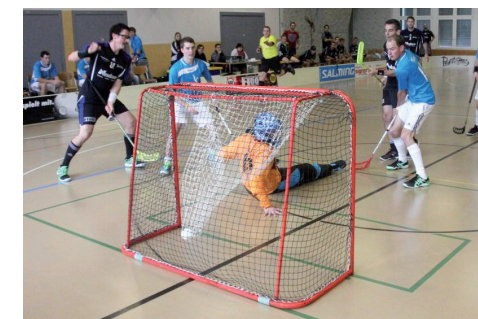
Impressionen aus der Heimrunde unseres Fanionteams