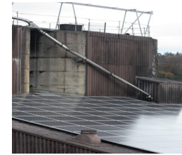
neue Fotovoltaikanlage, Siedlungshof Peter Spühler