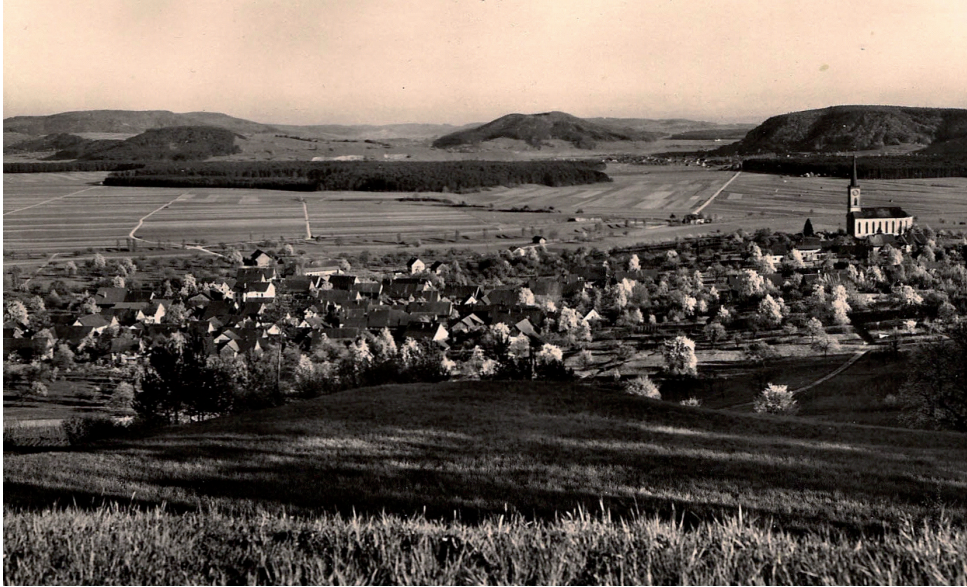
Dieses Bild von Wil (ungefähr 1940) zeigt die vielen Hochstamm-bäume von damals.

Bis in die 50er Jahre war der Hochstamm die Grundlage der Obstproduktion. Auf alten Bildern sind noch die Baumgürtel um die Dörfer zu sehen.