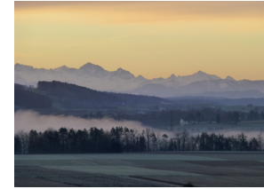
Spezielle Morgenstimmung