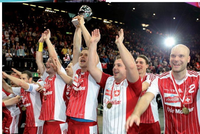
Impressionen der Schweizer Nationalmannschaft an der Heim-WM 2012