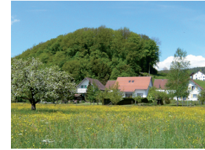
Blick von der Süesslerstrasse Richtung Brand