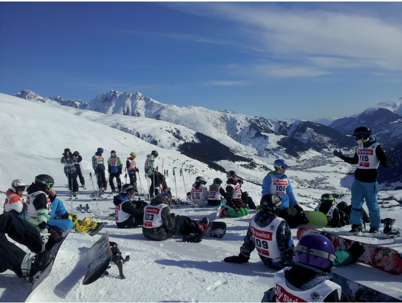
Auch ein Ski- und Snowboardrennen gehört zu einem Skilager