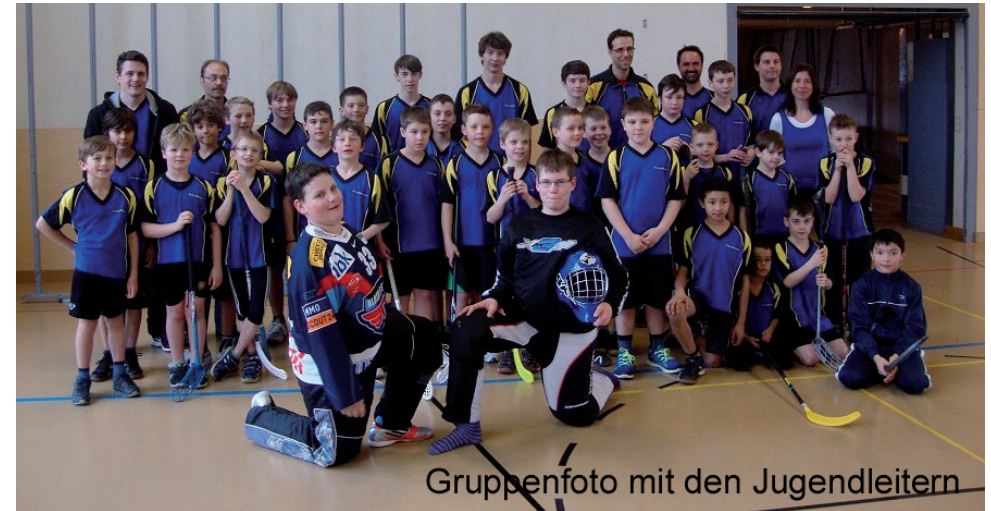
Gruppenfoto mit den Jugendleitern

Am Sonntag, 17. März 2013 nahmen wir mit 31 Jungturnern aufgeteilt in 5 Mannschaften am Rafzerfelder Jugi-Hallenunihockey-Turnier teil. In diesem Jahr durften wir in zwei Kategorien die Siegermannschaft stellen, wobei die erste Mannschaft wegen fehlender Konkurrenz nur gegen eine Leitermannschaft zu spielen hatte.