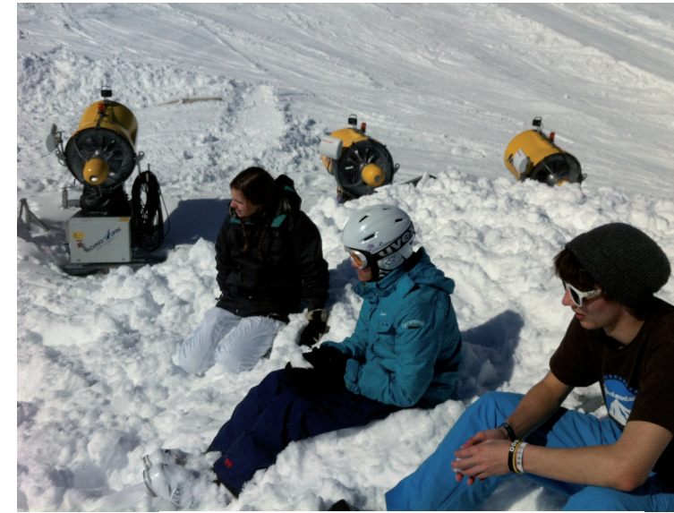
Die Märzsonne wärmte schon tüchtig

Uns 3. Sekler hat das Skilager mega viel Spass gemacht. Am Montagmorgen um 7 Uhr ging die Anfahrt mit dem Car nach Sedrun in Wil los. Wir hatten mega viel Spass bei der Carfahrt, leider durften wir