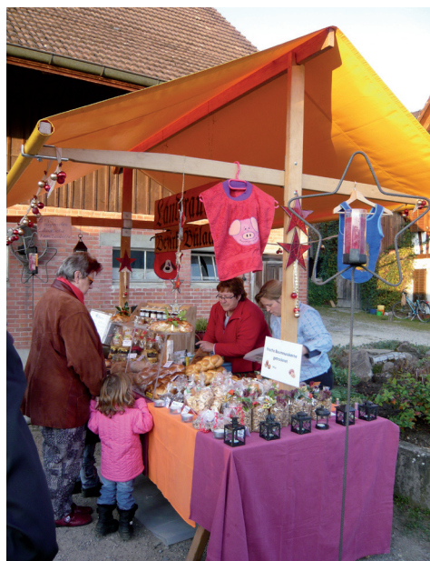
Schöner Stand am Advent-Märt