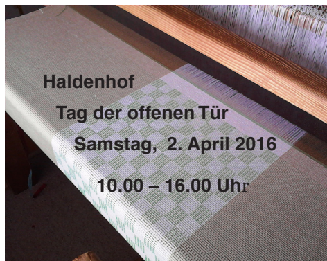
Klär Nussbaum, Webstubenteam www.webstube-wil.ch

uns ganz herzlich fürs Wohnrecht und Susans Hilfe wenn immer nötig.