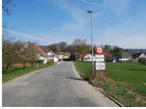
Westlicher Dorfeingang von Wasterkingen