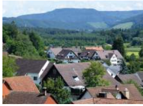
Ausblick vom Brand