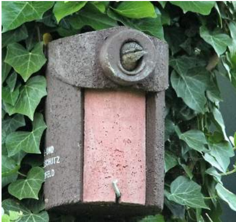
Jungvogel Wendehals

Nahrung: Insekten. Zur Brutzeit vor allem Ameisen (Larven, Puppen, weniger Imagines).