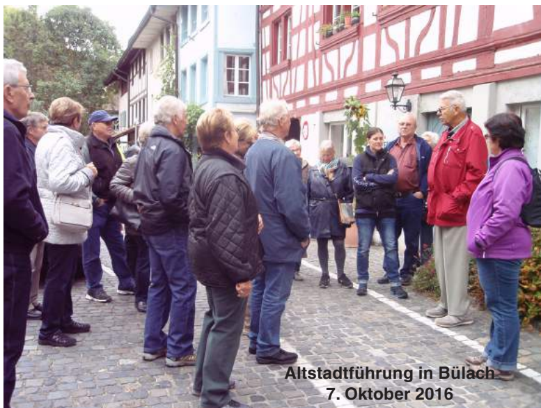
Altstadtführung in Bülach 7. Oktober 2016