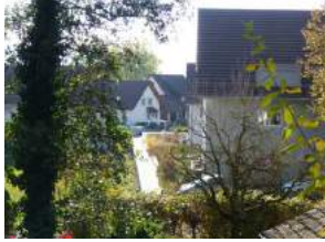
Blick von der Unterdorfstrasse ins Quartier Hueb