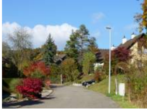
Herbststimmung am Schützenweg