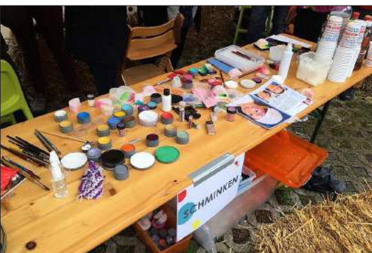
Die Schminkutensilien stehen bereit

Bereits gefeiert haben wir bekanntlich das Dorffest anfangs September. Über das