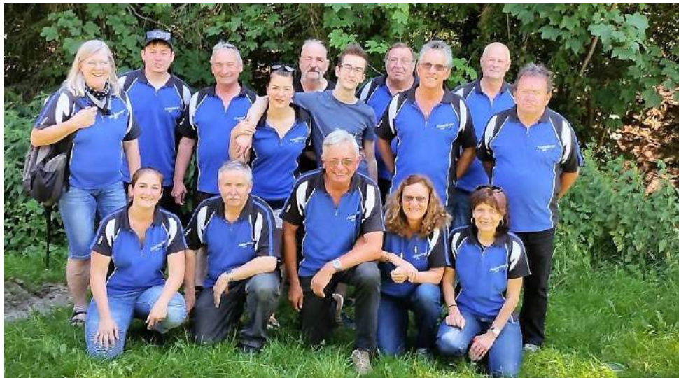
Das obligate Gruppenbild in Brittnau

Festsieger den hervorragenden 3. Platz. Bravo! Am abendlichen Grillplausch bei der Schützenstube in Wasterkingen konnten die Resultate nochmals diskutiert und gefeiert werden.