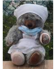
Ein Maskottchen war auch mit dabei