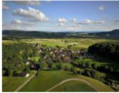
Nordanflug über Wasterkingen