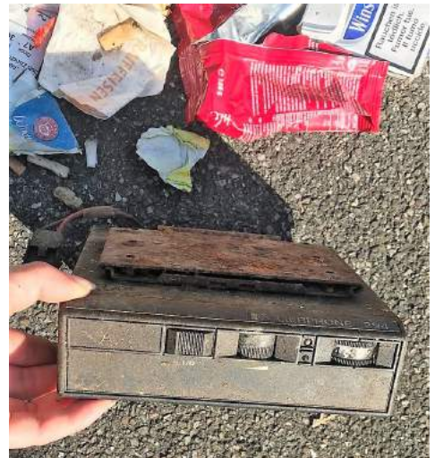
Kein naturverträgliches Produkt

Gelitterte Materialien lassen sich nicht in Stoffkreisläufe zurückführen und werden somit der Wiederverwertung entzogen. Es müssen neue Ressourcen mit all den damit einhergehenden Umweltauswirkungen gewonnen und verarbeitet werden. Littering ist ebenfalls eine Gefährdung für Tiere und Pflanzen.