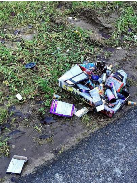
Hinterlassenschaft Silvester 2017

rer Grund findet man in der geringen sozialen Kontrolle im öffentlichen Raum, das heisst, Anonymität erhöht die Wahrscheinlichkeit des Litterings. Ein Phänomen, das durch Gruppeneffekte verstärkt werden kann. Die persönliche Werthaltung trägt wesentlich zum Littering bei. Dinge, die einen Wert haben, werden nicht zurückgelassen und Orte, zu denen eine persönliche Verbindung besteht, werden weniger verschmutzt. Es wird auch nicht überall und zu jeder Zeit gleich viel gelittert. An lauen Sommernächten in Erholungszonen wird mehr gelittert als an Plätzen mit Durchgangscharakter. Kurz: Die Ursache liegt im Verhalten des Menschen.