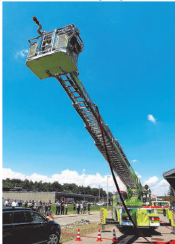
Die ADL bei einer Einsatzdemonstration für einen Löscheinsatz

Mit Stolz können wir behaupten, dass wir nach über 500 Mannstunden in der Lage sind, unsere neue Aufgabe mit bestem Wissen und Gewissen zu übernehmen. Für unsere Feuerwehr ist es ein Vertrauensbeweis mit einer ADL ausgerüstet zu sein und wir die technische Hilfeleistung bei Verkehrsun-