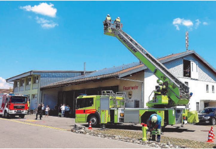
Die ADL bei einer Einsatzdemonstration für eine Rettung

fällen für den WUK übernehmen dürfen. An dieser Stelle möchte ich mich bei allen Beteiligten herzlich für das Engagement und das entgegen gebrachte Vertrauen bedanken. Ein besonderer Dank gilt es für die KP Sihlthal der Milizfeuerwehr von Schutz und Rettung Zürich auszusprechen. Weiter ist es der unkomplizierten Fahrzeugdisposition der Berufsfeuerwehr von Schutz und