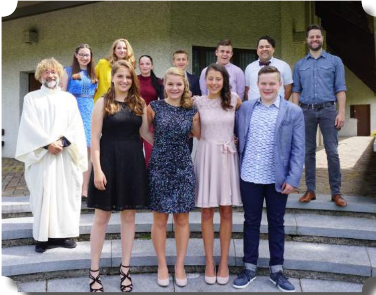
Die Kirchgemeinde freut sich, dass sie am Sonntag, 27. Mai neun junge Menschen konfirmieren durfte.