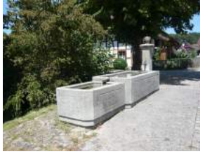
Dorfbrunnen an der Ausserdorfstrasse