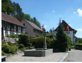
Lochbrunnen zwischen Unterdorfstrasse und Schulweg