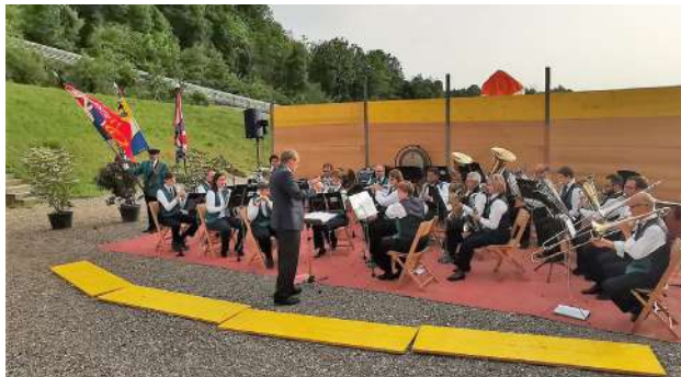
Sommerkonzert im Amphitheater Hüntwangen