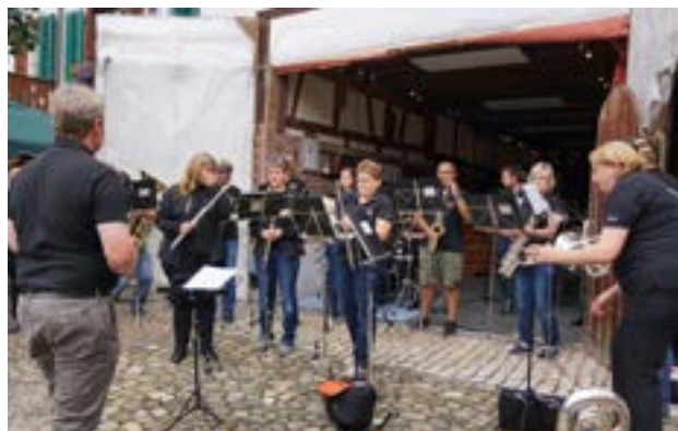
Noch am Einrichten bei Familie Baumann

Die ganze Züglete an die drei Standorte, war schon etwas sportlich, es ging Schlag auf Schlag. Erst am Schluss bei Neukoms kamen wir zum Verschnaufen und konnten uns über die wohlverdiente Bratwurst und etwas zu Trinken freuen. Ein herzliches Dankeschön an die drei Weinbauern für das gewährte Gastrecht. Es war „dä Plausch“.