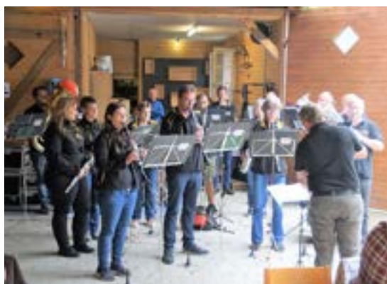
Bereits wieder am Musizieren beim Weingut Neukom.