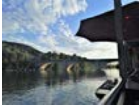
Rhein-Strassenbrücke Eglisau