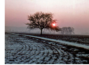
Winterlandschaft: Üsseri Längg, Februar 1968