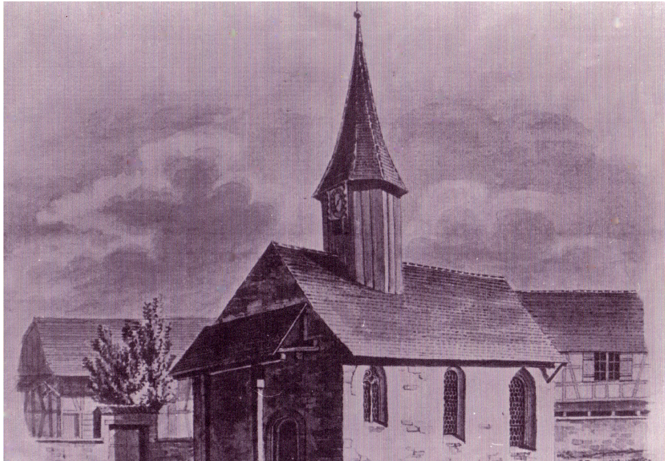
Zeichnung der 1851 abgebrochenen mittelalterlichen Kapelle von Ludwig Schulthess aus dem Jahre 1840

Für kleinere religiöse Handlungen bauten verschiedene Gemeinden eigene Kapellen im Laufe des Spätmittelalters. Dies dürfte im 15. Jahrhundert auch in Wasterkingen der Fall gewesen sein. Es ist unklar wann genau der Bau erfolgte, einen Hinweis gibt jedoch eine der beiden alten Glocken, die heute noch auf unserem Friedhof stehen.