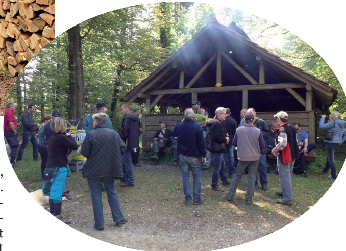
Die verdiente Stärkung oder der Schwatz bei der Waldhütte