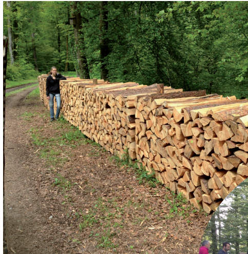
Das Angebot in Reih und Glied, sauber aufgerichtet

In Wasterkingen wurde seit 2001 keine Gant mehr durchgeführt. Im 2014 hat