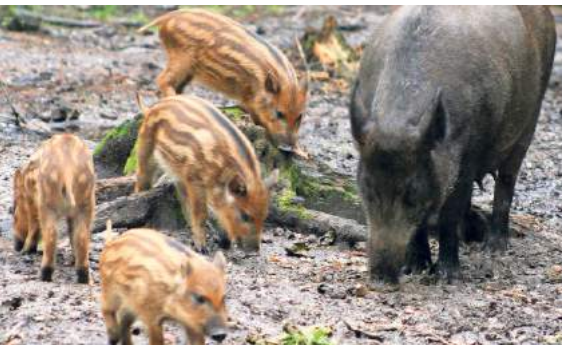
Eine Bache mit Frischlingen