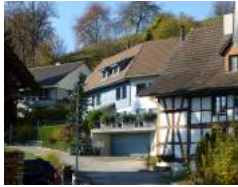
Häuserausschnitt - Sennhüttenstrasse