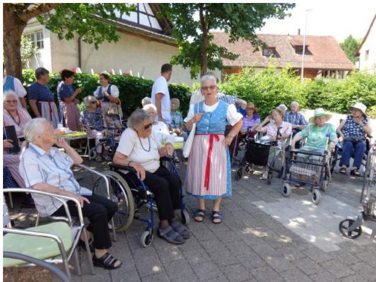
Singen im Altersheim Eglisau