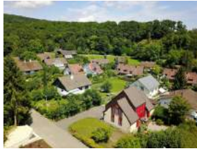
Quartier Stiegstrasse / Schützenweg