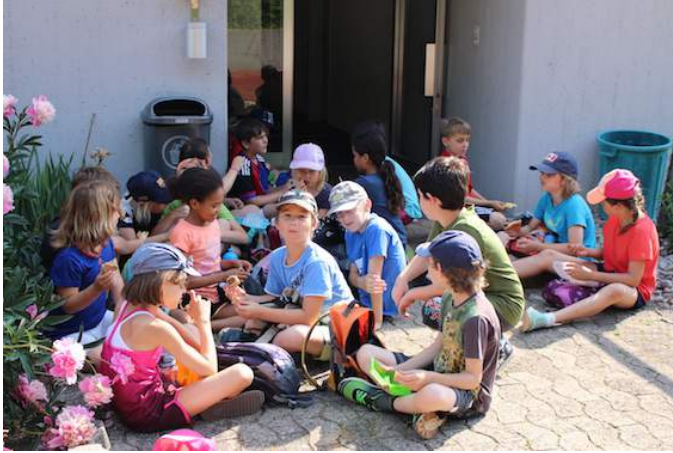
beim gemütlichen Znüni