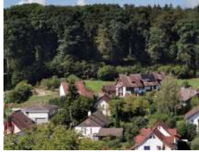
Blick vom Bising Richtung Westen (Stig)