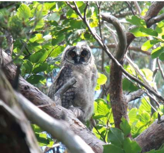
Junge Waldohreule

Erfreut über den Hinweis, machte ich mich am nächsten Abend auf den Weg, um die Waldohreulen mit eigenen Augen zu sehen. Tatsächlich machten die Jungen schon Flugübungen zwischen dem Schürlibuck und einzelnen Bäumen. Da sie sehr standorttreu sind, habe ich mir gedacht, ich werde dieses Jahr beim Schürlibuck einen Kontrollrundgang machen.